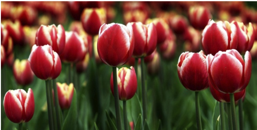
Las flores, esas musas discretas.

Publicado por: Lara Barreiro 11 febrero, 2016 Madrid