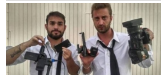
'Las Hienas' se defienden del altercado con Márquez con un vídeo... sin imágenes