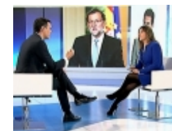
Pedro Sánchez, sin tirón en TVE, solo interesa a 2 millones