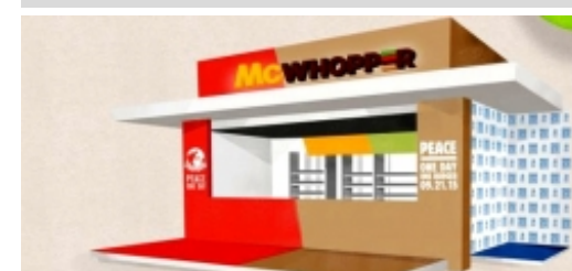
El McWhopper: la unión de Burger King y McDonald's por el día de la Paz