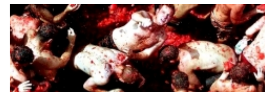
La Tomatina celebra sus 70 años con récord histórico de tomates

En un futuro, este Banco contará con el instrumental necesario para la conservación de esporas de helechos y hongos, así como para la extracción y conservación del ADN, con objeto de impulsar su capacidad de conservación de todo tipo de material vegetal.