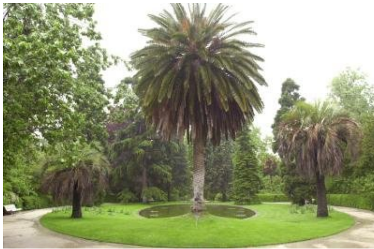
Jardín Botánico de Madrid.

El apagón, que se producirá de 20:30 a 21:20 horas el próximo sábado 29 de marzo , es una iniciativa impulsada por el Fondo Mundial para la Naturaleza (WWF) cuyo principal objetivo es sensibilizar a la sociedad sobre la necesidad de controlar más y mejor el uso de la energía, ha informado un comunicado de CSIC.