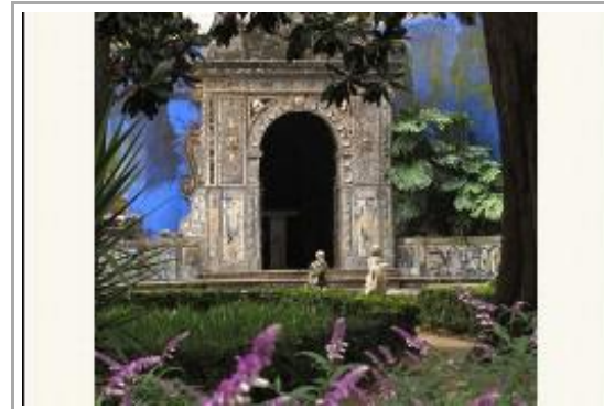
Jardines de Lisboa - Real Jardín Botánico de Madrid

Un fotógrafo paisajista, un escultor que emplea materiales orgánicos, y un novelista con vocación poética se han reunido para presentar sus tres ópticas combinadas en una visión tridimensional de los espacios verdes de la capital lisboeta. 'Jardines de Lisboa' es una ocasión para visitar de nuevo el Real Jardín Botánico, en su momento más espléndido, la primavera. Fotos, figuras y textos se despliegan en un contexto fabuloso, el Pabellón Villanueva y las cinco mil especies vegetales que le rodean, junto a otra exposición complementaria que llega desde Doñana, un repaso a los actuales desafíos ambientales.