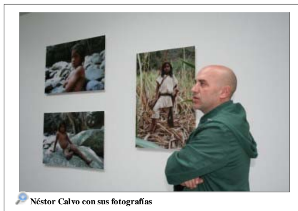
Néstor Calvo con sus fotografías

"Conseguir algunas de estas fotografías me llevó días de caminatas por senderos de montaña. Otras las pude realizar con más celeridad. Todas ellas reflejan la paz interior de un pueblo que lucha por defender sus derechos territoriales y culturales", asegura Néstor Calvo, conocido director de fotografía de películas como Flores Negras, Los Años Bárbaros, Lobo, Los novios Búlgaros o Los Lobos de Washington y nominado en el 2003 a un Goya a la mejor fotografía por su trabajo en la película "Nos miran".