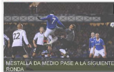
MESTALLA DA MEDIO PASE A LA SIGUIENTE RONDA