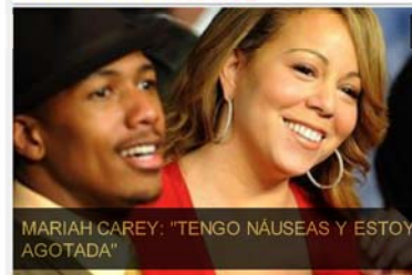
MARIAH CAREY: "TENGO NAÚSEAS Y ESTOY AGOTADA"