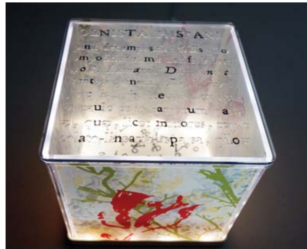
Título: Genista hispanica Autor : Stübing Año: 2015 Medidas: 24 x 24 x 24 cm Miniinstalación: ABS, metacrilato, acrílico e iluminación led