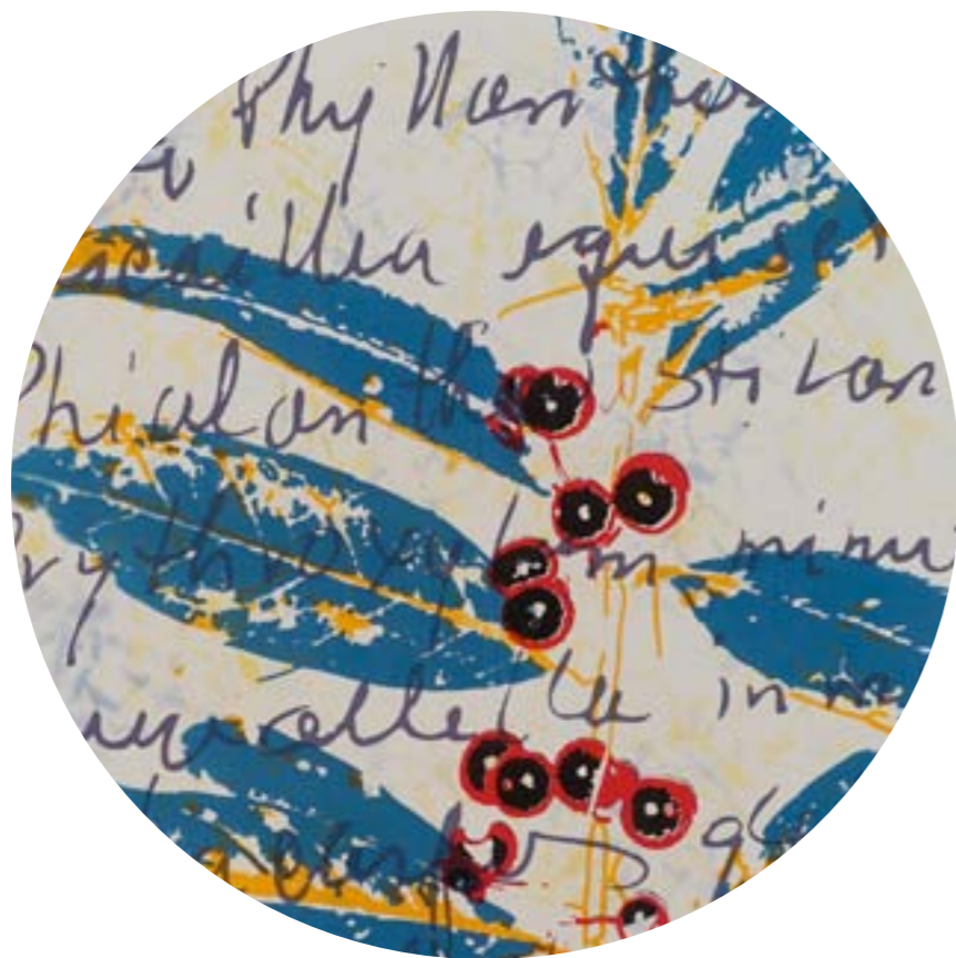
Título: Ilex cassine (detalle) Autor : Stübing Año: 2015 Medidas: 76 x 57 cm Técnica: Serigrafía intervenida y gofrado sobre papel Arches 88 de 300 g Serie "Flora Cubensis"