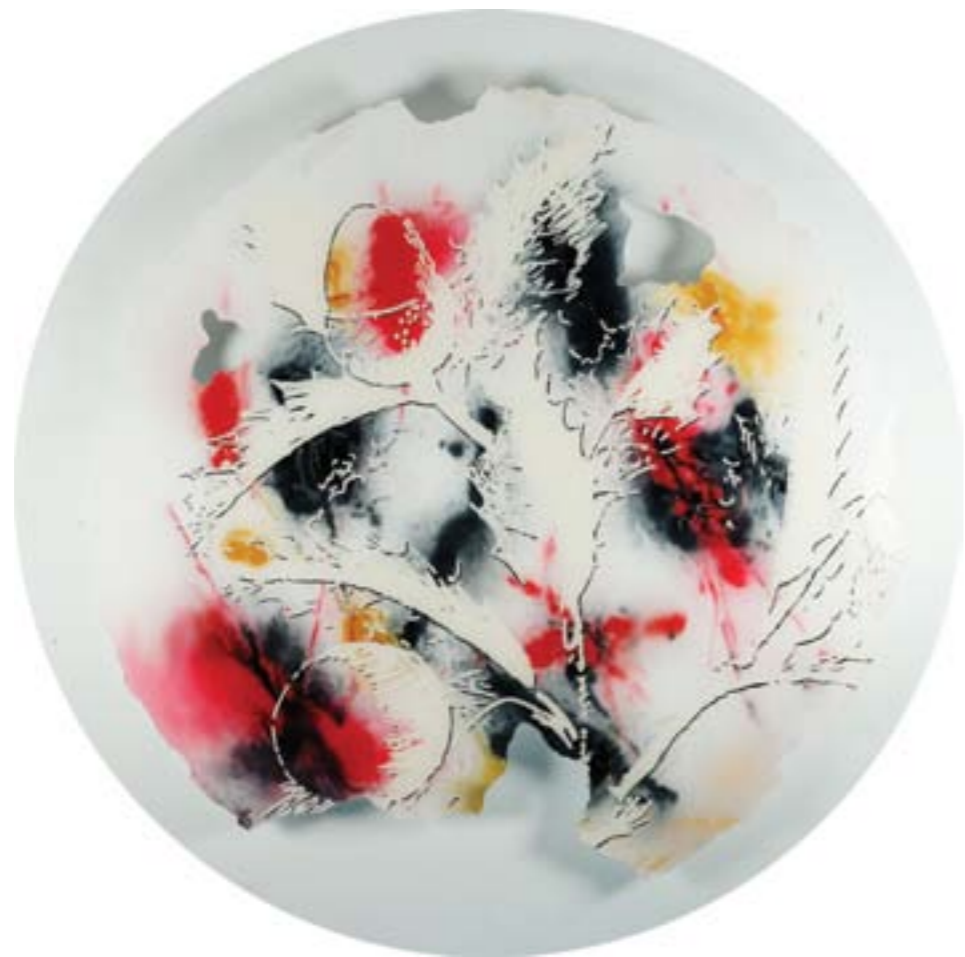
Título: Quercus valentina Tab. 129 Autor: Stübing Año: 2015 Dimensiones: 100 cm diámetro Técnica: Mixta sobre metacrilato perforado