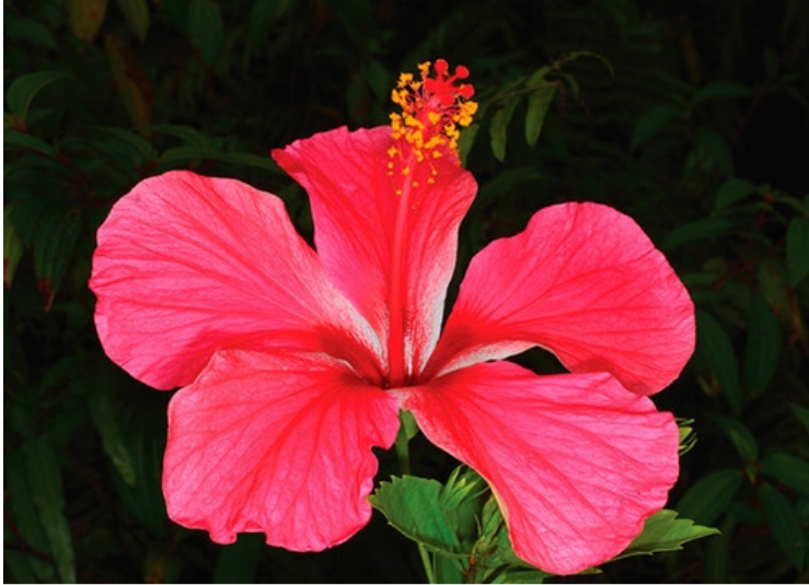
Ejemplar de Hibiscus rosa-sinensis , una de las plantas clasificadas en el estudio.

Dentro de la iniciativa Global Naturalized Alien Flora, los investigadores han recopilado listas regionales de todas partes del mundo y han agrupado los datos en una base global denominada GloNAF.