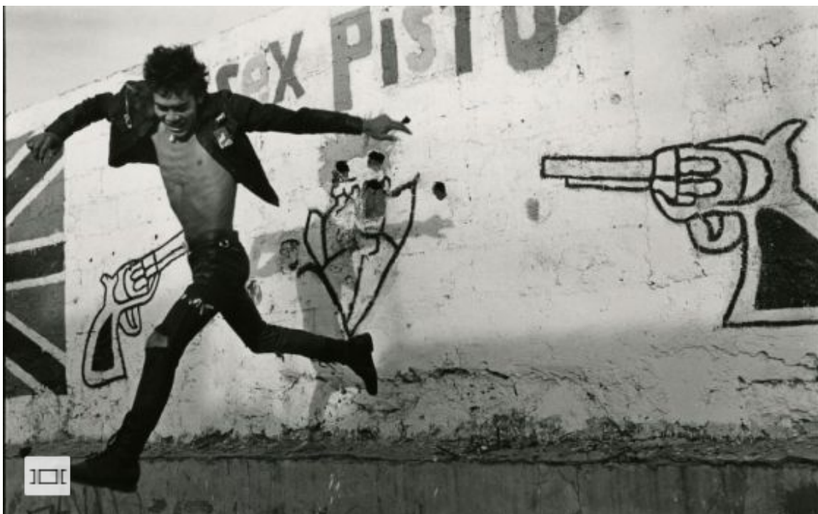
'Volando bajo' (1988). / PABLO ORTIZ MONASTERIO

Archivado en: PPhotoEspaña Exposiciones temporales Tina Modotti Alberto Díaz Gutiérrez "Korda" Fotografía Festivales culturales Festivales Artes plásticas