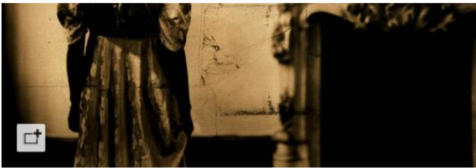
'El amor coagulado'. De la serie 'Jerarquías de la intimidad', 2005. / LUIS GONZÁLEZ PALMA

La vida cotidiana de este país norteamericano también fue retratada por Manuel Carrillo, su mirada de antropólogo buscando el detalle de su pueblo se refleja en Mi querido México en el Museo Lázaro Galdiano hasta el 30 de agosto.