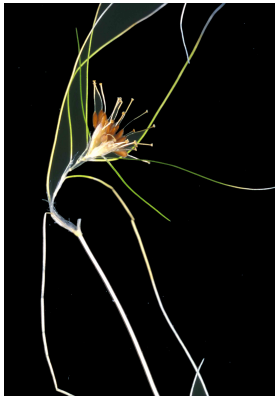
Flor acuática conocida como “pelos de vieja”.

De todo este compendio, pensado tanto para científicos, como estudiantes y público en general, Santos Cirujano no duda en señalar como reinas de la baraja , por estar protegidas, al “ bocado de rana ” ( Hydrocharis morsus-ranae ) y a los “ pelos de vieja ” ( Althenia orientalis ).