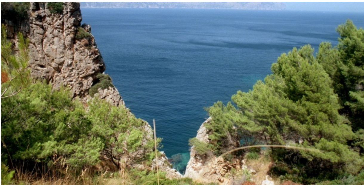
Cabo Pinar, uno de los paisajes del archipiélago balear situado en L'Alcúdia.

Publicado por: Redacción EFEverde 22 septiembre, 2014 Palma de Mallorca