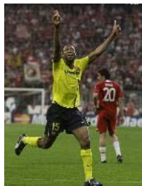
El Barça pasa a semifinales con un partido inteligente