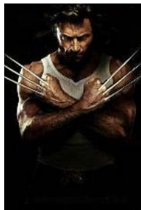
Hugh Jackman, un "lobezno" entre hormigas

LA ACTUALIDAD MÁS VISITADA EN WWW.EUROPAPRESS.ES