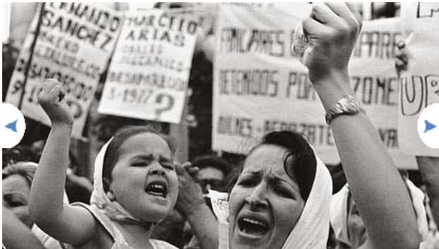
Una de las imágenes de Adriana Lestido

► Visita la web oficial de PhotoEspaña 2010